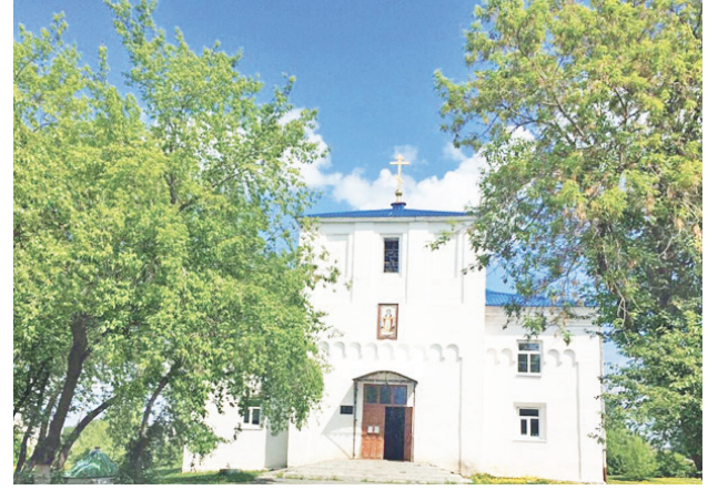
...и в настоящее время.