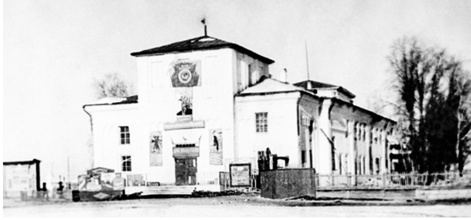
...в советский период...