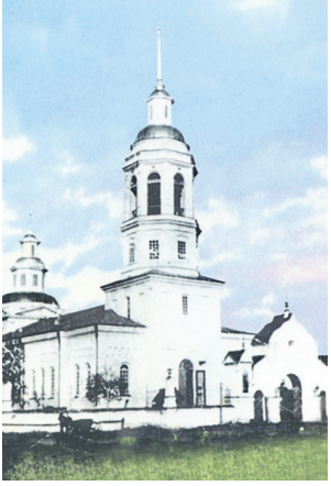
Храм до революции...